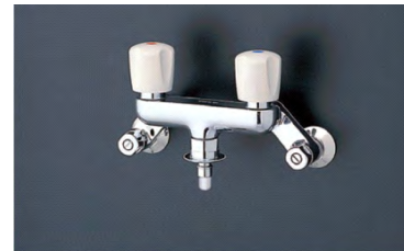
緊急止水弁付2ハンドル混合栓 TW20-1RZ